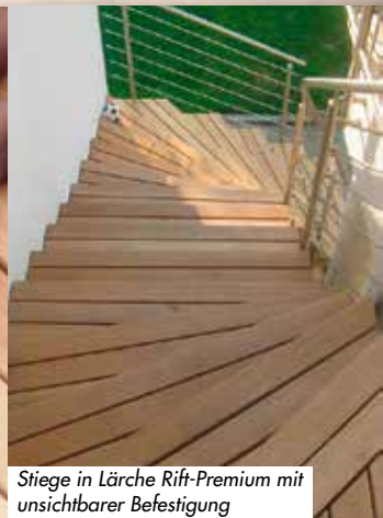
Stiege in Lärche Rift-Premium mit unsichtbarer Befestigung