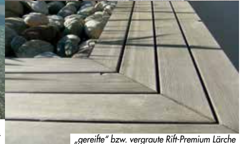
auch anspruchsvolle Grundrisse werden in wegnehmbaren und vorgefertigten Elementen montiert