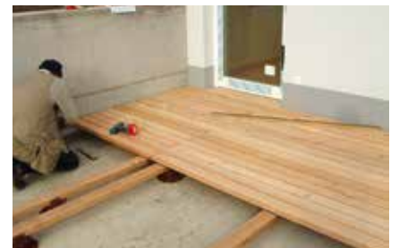
Einfachste Montage der fertigen Elemente