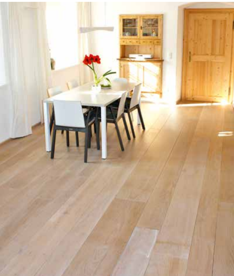
Klosterdielenboden Heimische Eiche weißlich geölt