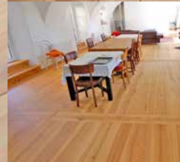
Klosterdielenboden Lärche gelaugt und geölt