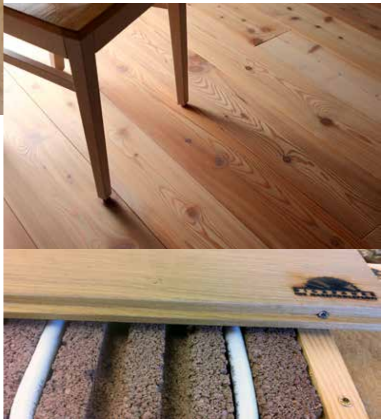
Fußbodenheizung mit Trockenestrich direkt unter dem Massivdielenboden

Wir können unsere Massivdielenböden sowohl auf Naßestrichen als auch auf Trockenestrich-Systemen mit Fußbodenheizung verlegen.